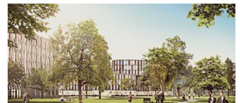
II AREAL 12 IM PARK