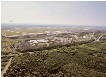
II BLICK VON FRANKFURT