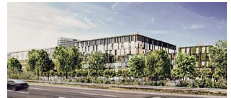
II AREAL 17 GEGENÜBER DES FLUGHAFENS