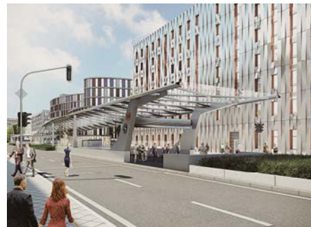
II S-BAHN STATION, AB 2019